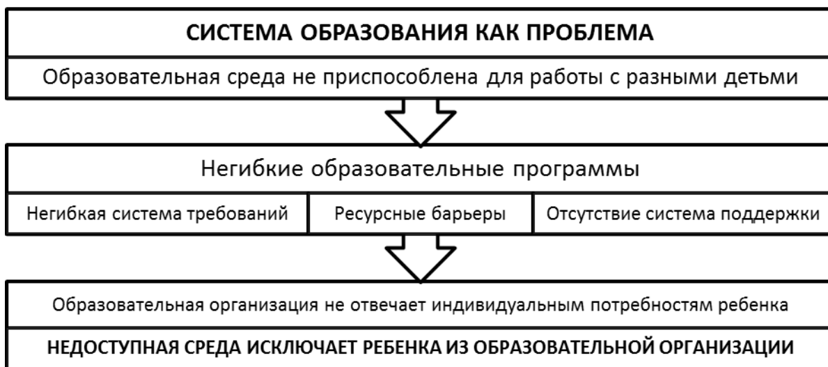
Рис. 4 Социальный подход в образовании (система образования как проблема)

Заявлено право каждого человека с умственной отсталостью на «образование, обучение, восстановление трудоспособности и кровительство, которые позволят ему развивать свои способности и максимальные возможности»