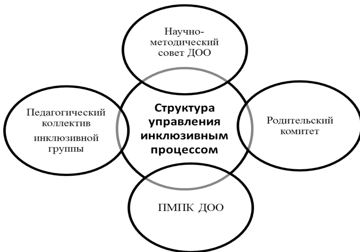
Рис. 6 Структура управления инклюзивным процессом в дошкольной образовательной организации

Вместе с тем в настоящее время остаются недостаточно теоретически разработанными и не в полной мере методически апробированными направления использования образовательного пространства сетевого взаимодействия, обеспечивающего поддержку развития ребенка дошкольного возраста с ограниченными возможностями здоровья.