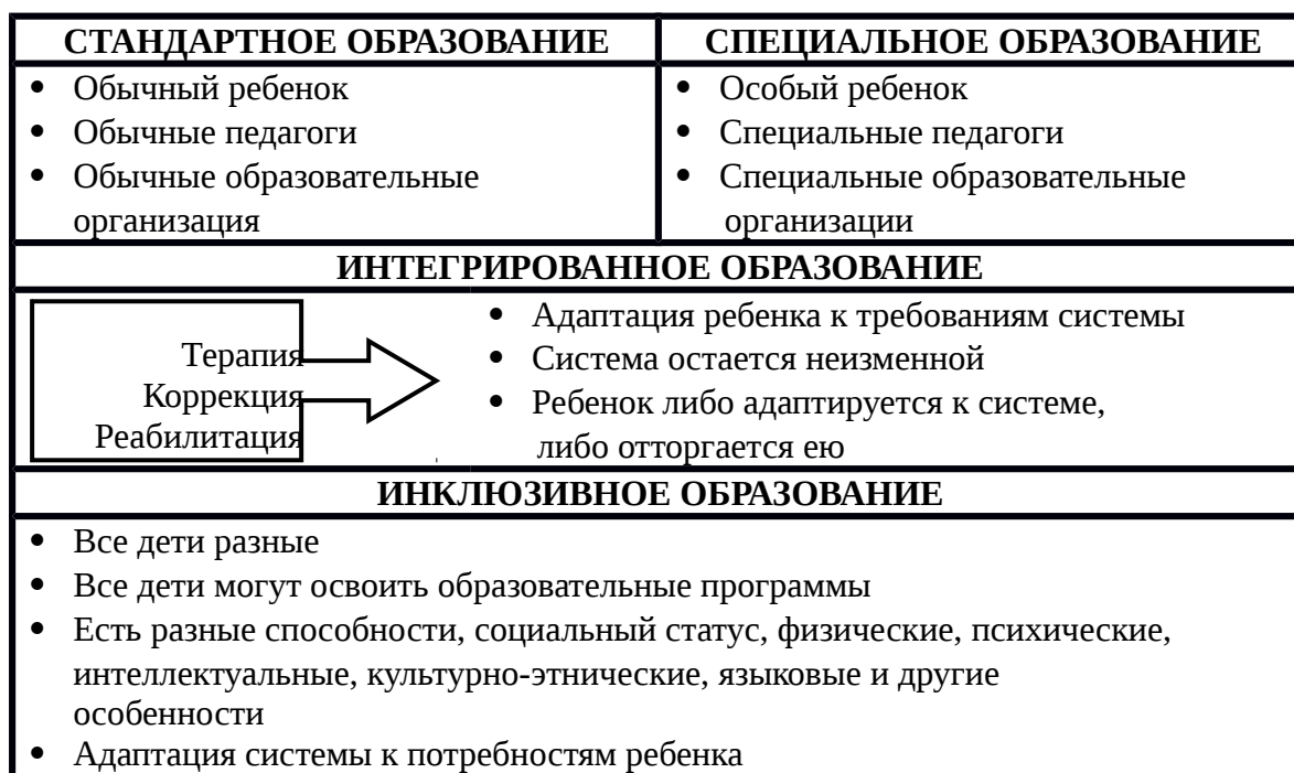
Рис. 1 Системы образования

К концу XX столетия во многих развитых странах мира (США, Великобритания, Швеция, Германия, Италия) ведущей стратегией в образовании детей с ограниченными возможностями здоровья стало интегрированное образование, которое ведет к исключению этих детей из социальной жизни и создает определенные барьеры в общении и взаимодействии детей. Поэтому от интеграции перешли к инклюзии - совместному обучению и воспитанию детей с ограниченными возможностями здоровья (рис. 1). На рис. 2 отражены основные теории и концепции инклюзивного образования.